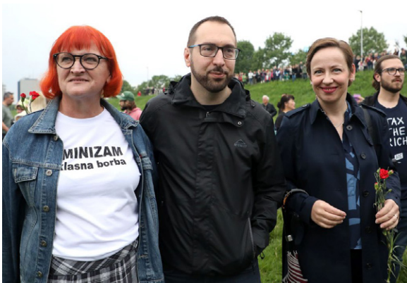
Udruženje za razvoj kulture, Trnjanjski kresovi, Foto - HINA (Lana Slivar Dominić)