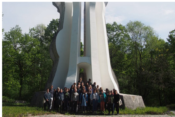
BLOK, Foto - Politička škola za umjetnike, posjet partizanskom spomeniku u šumi Brezovici, Blok.hr

i aktivizam BAZA, smješten na Trešnjevci, najvećem zagrebačkom kvartu. 2018. pokrenuli smo dugoročni projekt Muzej susjedstva Trešnjevka koji predstavlja okvir za rad u lokalnoj zajednici, kroz izgradnju virtualnog fundusa, umjetničke produkcije te različite kulturno-umjetničke i socijalno angažirane programe. Naše aktivnosti prožima suradnja s kulturnim i obrazovnim institucijama te umjetničkim i aktivističkim inicijativama na lokalnoj i međunarodnoj razini“. Udruga navodi kako BLOK radi u nesigurnim materijalnim uvjetima, kao i brojne druge organizacije nezavisne kulture. Kao odgovorne osobe navode se Ana Kutleša i Maja Blažević. 199)