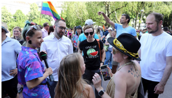
Zagreb Pride

Gradska vlast Možemo sponzor je i sudionik takozvane „povorke ponosa“ svake godine u mjesecu lipnju. Gradonačelnik Tomašević i zamjenik Luka Korlaet 2024. godine s ponosom su istaknuli svoje sudjelovanje u povorci. Na službenim stranicama Grada Tomašević je poručio: „Po četvrti put sam kao gradonačelnik Zagreba došao podržati Pride, to je bilo obećanje građanima i držim se te tradicije. Prvi Pride u Zagrebu je održan 2002. godine, situacija u državi se u međuvremenu promijenila,