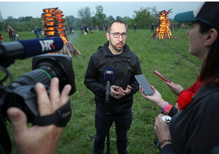
Mreža antifašistkinja Zagreb, Trnjanski kresovi

tom sa srodnim organizacijama unutar ili izvan zemlje. Udruga mladih antifašista javlja se kao nužna reakcija na zbivanja u Hrvatskoj i regiji, naročito tijekom i nakon 90-ih godina prošlog stoljeća koje su obilježile toleriranje desničarskih tendencija, revizija i rehabilitacija povijesti u smislu veličanja ustaškog režima i negiranja zločina počinjenih prema nacionalnim ili vjerskim manjinama, negiranja antifašističke povijesti i sustavnog uništavanja antifašističke baštine, a sve pod pokroviteljstvom političkih i crkvenih elita“, piše na stranicama udruge. Također, navodi se i kako „hijerarhijske strukture nema, a sve odluke, na mjesečnim skupštinama, donosi tridesetak aktivnih članova“. Na stranici se imenuju tek dva člana uredništva portala Maz.hr. To su Jan Bantić i Kiša Bizović Grgas. 570)