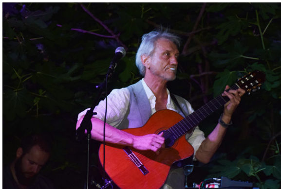
CARGO, Darko Rundek

U intervjuu za portal Ravnododna (udruga Jedna nova poruka), Rundek je otkrio kako je ekološki osviješten i zabrinut zbog klimatskih promjena. Kritizirao je i ekonomski i socijalni model u kojem živimo, misleći pritom na kapitalizam. Pohvalio je ljevičarsku aktivisticu Gretu Thunberg: „I sad, kako je sve naglavačke, djeca moraju prozivati odrasle da budu odrasli“, rekao je o njezinom govoru u UN-u. Odgovarajući