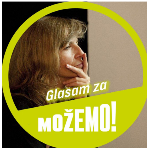
Udruga za interdisciplinarna i interkulturalna istraživanja, Foto - Sonja Leboš, Facebook

Na Facebook profilu Leboš profilnom fotografijom ističe svoju privrženost stranci Možemo. „Glasam za Možemo“ slika je koja predstavlja Leboš još od srpnja 2020. godine. 374)