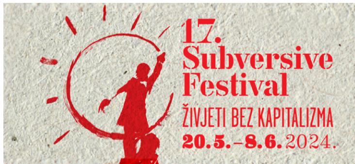
Bijeli val - 17. Subversive Festival

O kakvom je festivalu riječ najbolje svjedoči gošтовanje poznate američke komunistkinje i feministkinje Angele Davis koja je stigla u Zagreb održati predavanje 7. lipnja. Organizatori su je opisali kao aktivisticu, feministicu i teoretičarku „crnog marksizma“ koja se profilirala na čelu Komunističke partije SAD-a tijekom 1960-ih. U tom periodu surađivala je i s marksističkom organizacijom Crne pantere. Kako je posvjedočila u intervjuu za Guardian , onoga trenutka kada je u srednjoj školi pročitala Komunistički manifest, postala je uvjerena komunistkinja. Nedugo nakon što je dobila otkaz na kalifornijskom sveučilištu zbog članstva u Komunističkoj partiji i javnih govora u kojima je pozivala na revoluciju, Davis je optužena za sudjelovanje u otmici i ubojstvu američkog suca Harolda Haleya. FBI je 18. kolovoza 1970. za njom raspisao tjalericu. Uhićena je nakon dva mjeseca bijega i u zatvoru je provela nešto više od