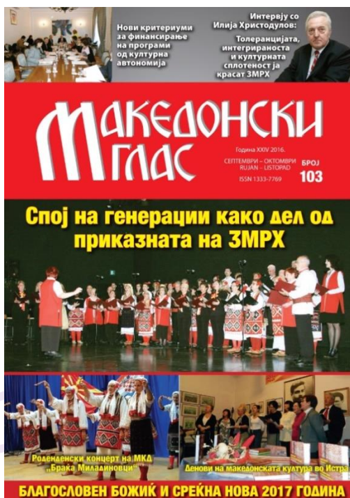
Slika 1 Makedonski glas

Na prvi pogled je vidljivo kako navedeni časopisi uistinu promiču kulturu i običaje svojih naroda, a što se može utvrditi i ako zavirimo u njihov sadržaj. U fokusu su kulturno-umjetnička društva, okrugli stolovi i tribine povezani sa životom pojedine nacionalne manjine, obilježavanje različitih obljetnica i prikazivanje bogatstva nacionalnih manjina.